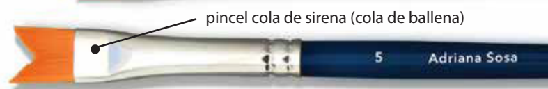
pincel cola de sirena (cola de ballena)